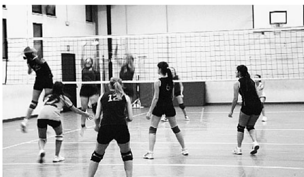
Un'azione di attacco dell'Inzani di Seconda divisione