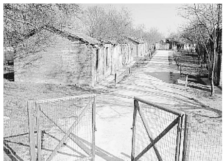
Il campo di Fossoli

SORBOLO Gita particolare Per non dimenticare Studenti in visita al campo di Fossoli