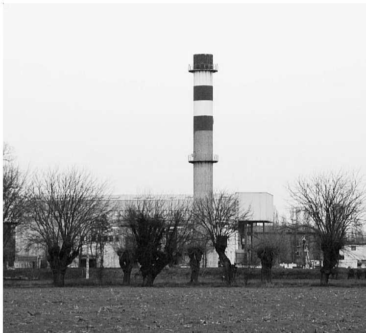
Il vecchio inceneritore del Cornocchio

«Ormai da diversi anni il nostro gruppo propone la realizzazione di alcune iniziative a favore dell'ambiente a Fontanellato come l'installazione di pannelli solari fotovoltaici e la centrale di distribuzione dell'acqua minerale gratuita che solo ora l'amministrazione comunale realizzerà con grande ritardo rispetto ad altri comuni e questo perché sono iniziative promosse da Provincia e Emilia Ambiente», dicono i consiglieri di minoranza. Quello che ora preoccupa la minoranza consiliare fontanellatese è il forno inceneritore di cui è prevista la realizzazione alla periferia di Parma: «Oltre essere un costo per i cittadini anche di Fontanellato sarà un grosso diffusore