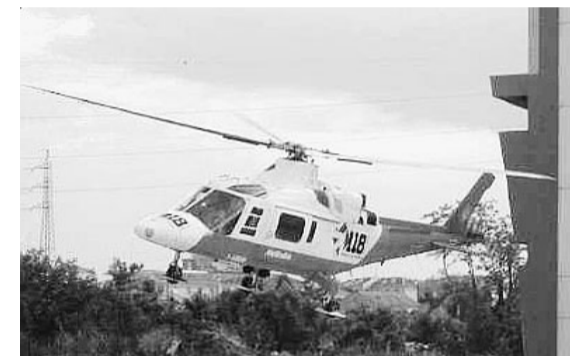
Il ferito è stato trasportato in ospedale in elicottero

Momenti di paura ieri alla Battioni&Pagani, Mazienda che produce carrelli elevatori, di Sorbolo dove un operaio è rimasto ferito in un infortunio sul lavoro. L'incidente è avvenuto ieri mattina intorno alle 9,30. La dinamica non è ancora stata del tutto chiarita.