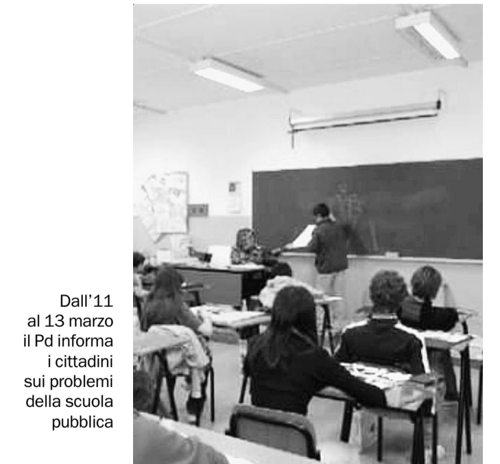
Dall'11 al 13 marzo il Pd informa i cittadini sui problemi della scuola pubblica