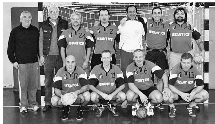
L'altra formazione "Vecchie Glorie". Il match si è giocato domenica

■ La Cold Point under 18 cede ai campioni d'Italia in carica del Romagna Handbal per 31 - 22