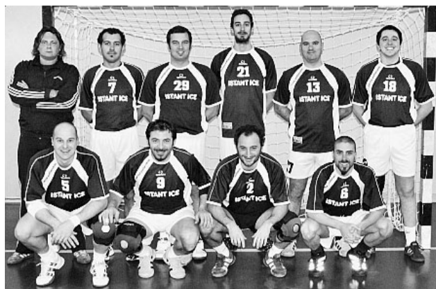
Una delle formazioni di "Vecchie Glorie" parmensi

■ La Cold Point under 18 cede ai campioni d'Italia in carica del Romagna Handbal per 31 - 22