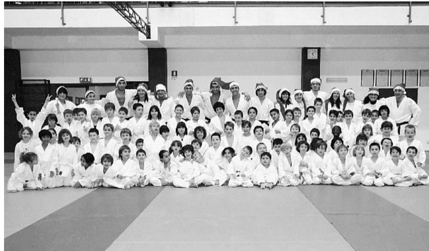
I duecento bambini del Ksdk durante la consueta festa di Natale

Con l'avvicinarsi delle feste di fine anno torna intanto anche la festa di Natale che Ksdk organizza per tutti i suoi bambini. Lo scorso 12 e 13 dicembre, ad animare le materassine della Scuola parmigiana, sono stati gli oltre duecento bambini che Ksdk ha radunato per fare judo insieme, festeggiare e scambiarsi gli auguri. I bambini provenivano da tutti i corsi che la Scuola tiene a Parma presso la sede centrale ed in collaborazione con gli Istituti Sanvitale, Micheli, San Benedetto e Scuola per l'Europa, oltre