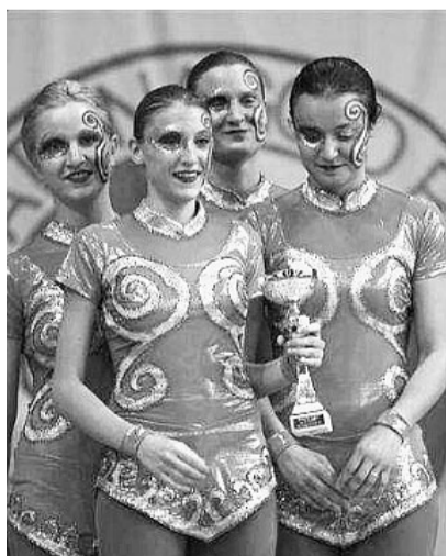
Il quartetto di "interpretazione orientale"

Dopo alcuni anni di assenza sono ritornati a Salsomaggiore al palazzetto dello sport i campionati nazionali di pattinaggio a rotelle Uisp organizzati dalla locale società sportiva Salsoroller. A fronte di un centinaio di squadre arrivate da tutta Italia e circa 1500 atleti, ben si sono comportati i pattinatori di casa che hanno piazzato due squadre ai primi due posti nella categoria "gruppi": medaglia d'oro nella categoria classica per "Aggiungi un posto a tavola" che ha sbaragliato tutti gli avversari per il secondo anno consecutivo, mentre quella d'argento nella