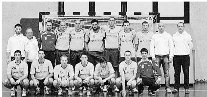
La rosa dell'Azeta Parma

Ma così non è stato questa volta. L'inizio della ripresa è stato infatti deleterio per i gialloblù. Un primo break di 4 gol per il Pescara, 1 gol del Parma ed un altro break di 4 gol per