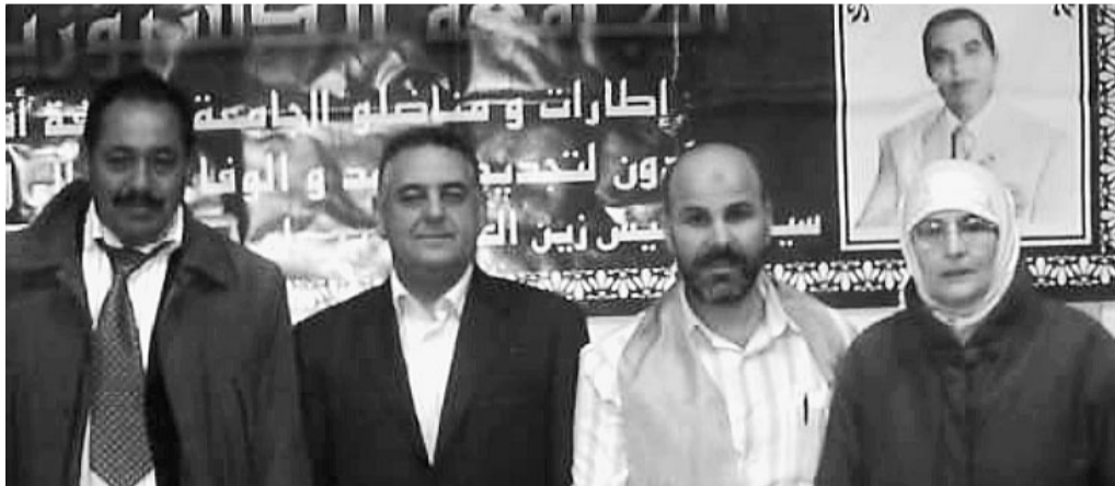
A destra, il presidente Zin El Abidin Ben Ali. A sinistra, Fridji Naceur, il console Mondher Marzouk, Ben Jeddou e Kraiem Rebeh. Sotto, un momento della festa e le donne che hanno lavorato per realizzarla, con al centro Monia Harrabi

Una grande festa, allestita dalla Comunità Tunisina di Parma nei locali della scuola araba di via La Spezia, ha salutato la vittoria del presidente che dal 1987 ha cambiato volto al Paese africano, assicurando stabilità, sviluppo e sostegno alle fasce deboli della popolazione. Uno spicchio di Tunisia in terra parmigiana, tra piatti e dolci tipici, musiche tradizionali e tanto divertimento. Ma la festa che ha visto la presenza di oltre duecento cittadini tunisini - molte le donne - ha rappresentato anche un momento per fare il punto sulla situazione politica e amministrativa del Paese d'origine, che non sembra voler dimenticare i suoi emigranti in ogni parte del mondo.