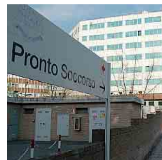
Il Pronto soccorso di Parma

In via Gorizia, infine, è intervenuto un mezzo del 118 alle 14 di ieri. In tutti gli episodi sono intervenuti anche agenti della polizia municipale di Parma che hanno eseguito i rilievi di legge.