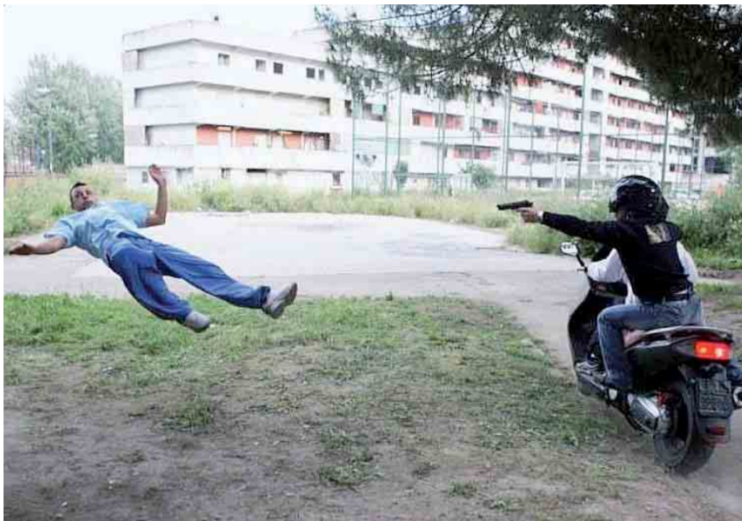
Una scena del film "Gomorra" di Matteo Garrone, tratto dal romanzo omonimo di Saviano

Nella sezione dedicata alla camorra e, in particolare, alle famiglie casalesi, il dossier della Dia definisce «invariate» le valutazioni dello scorso semestre e ribadisce «il tentativo d'infiltrazione nel tessuto sociale ed economico della regione». Le organizzazioni di Casal di Principe stanno proiettando «ormai da anni la propria sfera d'influenza criminale anche