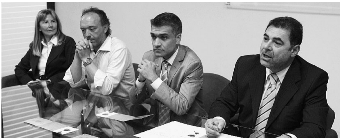
Festa del dono La presentazione di ieri in municipio dell'iniziativa che si terrà sabato e domenica in piazza Garibaldi

Week end in festa. Lasagna: volontari contro la crisi