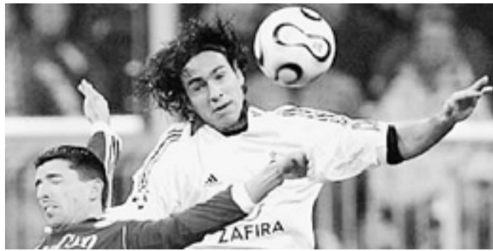
Il difensore del Milan, Alessandro Nesta, ieri in gol

conera. Un salvataggio in mischia di Jarolim (bravissimo) su tiro di Ambrosini al 27' è stata l'unica vera occasione rossoneri e sembrava che il Milan si stesse avviando verso una clamorosa sconfitta. Invece al 46' in mischia Nesta ha segnato un gran gol al volo di destro: il Siena è stato sfortunato, anche perché Grimi (milanista in prestito) è stato ingenuo provocando una punizione dal limite su Seedorf risultata poi decisiva. Poi il Milan ha sfiorato clamorosamente la vittoria al 50': punizione di Seedorf, palla sotto la traversa e poi in campo. Finisce 1-1, giusto così.