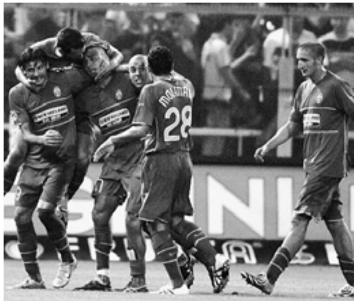
L'esultanza dei giocatori della Juventus

■ PROSSIMO TURNO. Atalanta-Lazio, Cagliari-Palermo, Catania-Fiorentina, Empoli-Napoli, Livorno-Inter, Milan-Parma, Roma-Juventus, Sampdoria-Genoa, Torino-Siena, Udinese-Reggina